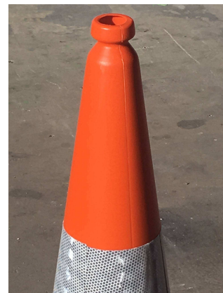
Asidero en la parte superior